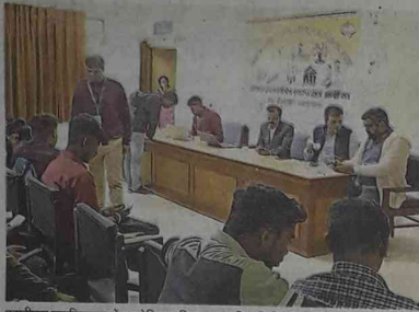
एसबीएस महाविद्यालय में आयोजित करियर काउंसलिंग शिबिर में भाग लेते छात्र

महाराष्ट्र के पूर्व राज्यपाल व उत्तराखंड के पूर्व मुख्यमंत्री बीएस कोश्यारी सहित नेता प्रतिपक्ष यशपाल आर्या ने कि