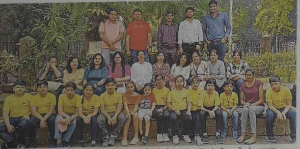
बाजपुर में सेक्टर सवालक एवं अपने खजाने के साथ मुंबई में मेडल जीतने वाले यूसी मास बाजपुर सेक्टर के प्रतिभाशाली बच्चे