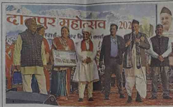
दानपुर महोत्सव में जनता को संबोधित करने पूर्व राज्यपाल भगत सिंह कोश्यारी