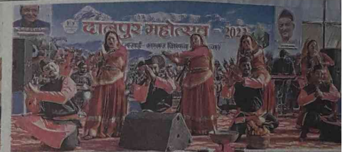
शांतिपुरी में आयोजित दानपुर महोत्सव में सांस्कृतिक नृत्य प्रस्तुत कर लोक कलाकारों ने दर्शकों का मन मोह लिया •