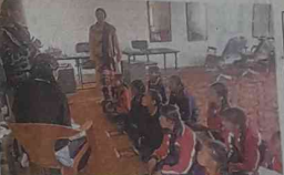
खटीमा के राजकीय बालिका इंटर कालेज में रोजगारपरक जन्मद्वारियां तैयारी में भाग लेती छात्राएं • जगन्नाथ